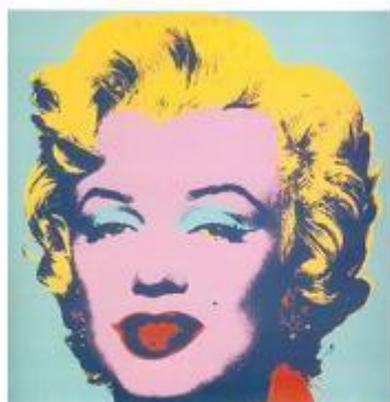
"Marilyn" de Andy Warhol, en Wikimedia Commons bajo dominio público.

El siglo XX comienza con las primeras vanguardias, las tendencias se multiplican, predominando el color en los fovistas, la fragmentación de la forma en los cubistas, lo onírico en el surrealismo o la psicología en los personajes del expresionismo.