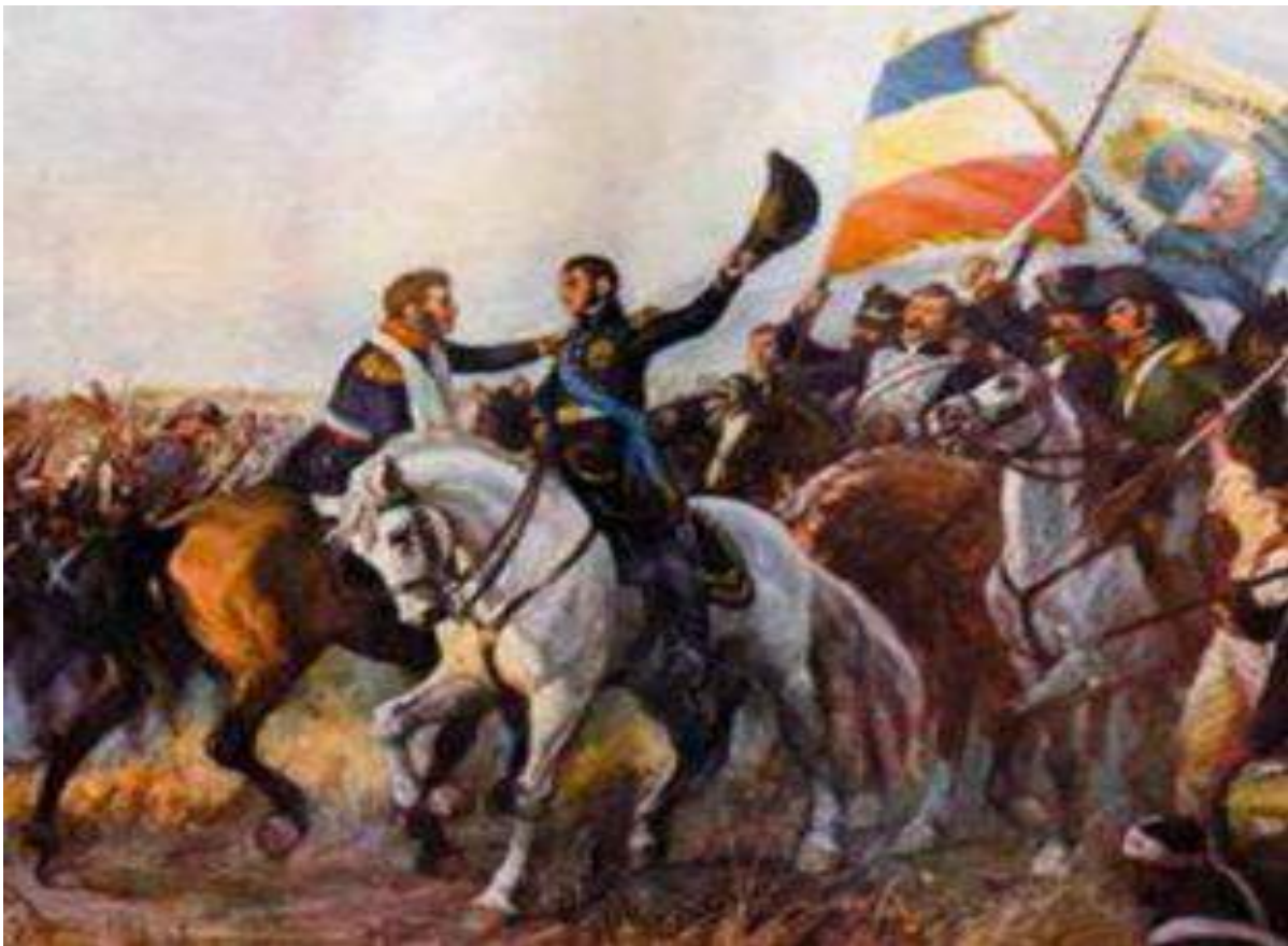
Abrazo de Maipú entre José de San Martín y Bernardo O'Higgins.