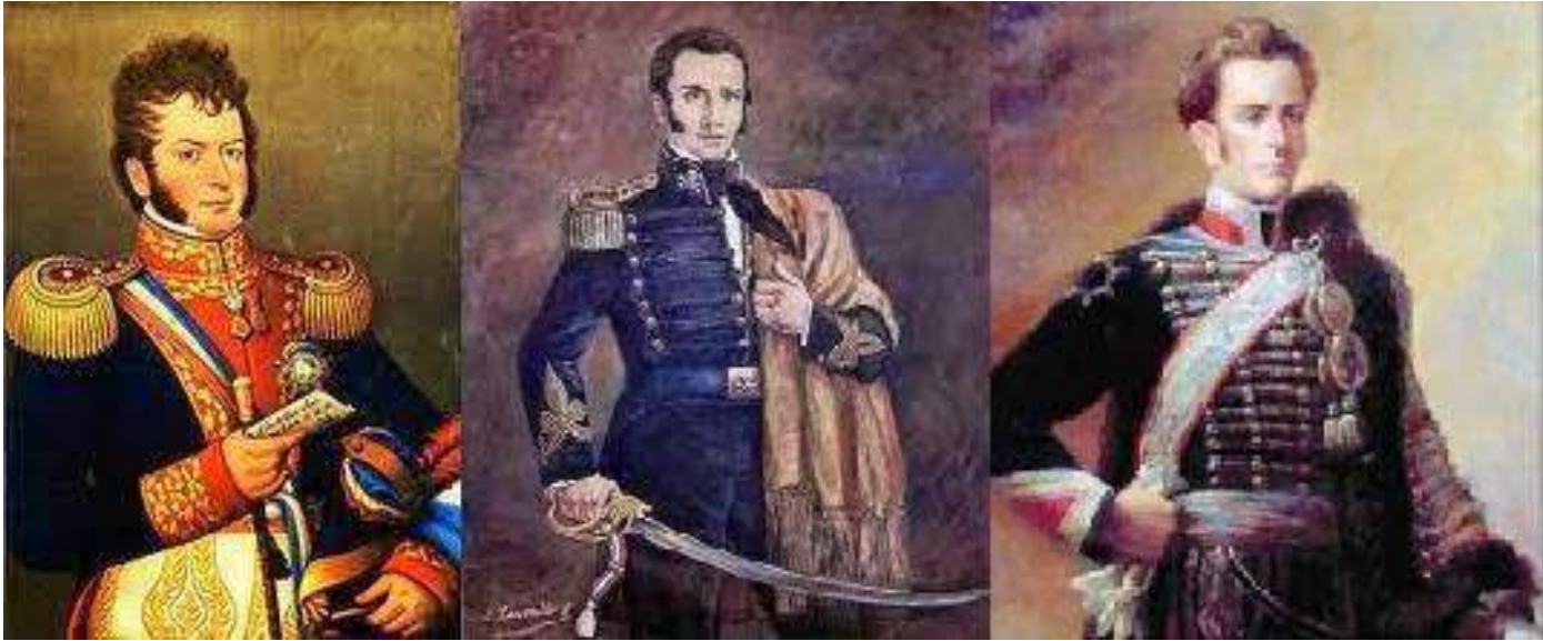
Los padres de la patria O'Higgins, Manuel Rodríguez y José Miguel Carrera.