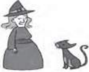
His / Her cat is black.