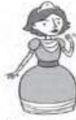
His / Her hair is short.