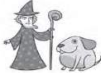
His / Her dog is fat.

4.- Identify the character . Number according to the instruction. ( Numera a los personajes de acuerdo a la descripción) Escribe los números de forma clara y al lado del personaje