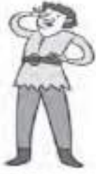
His / Her legs are long.

3.- Circle the right answer HIS / HER. ( Encierra HIS O HER)